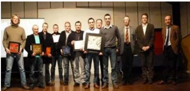
Les Trophées des entreprises : une action phare organisée chaque année par le club des entreprises CELIA

Par filière, dans le domaine du commerce-artisanat en particulier : la communauté compte 3 unions commerciales.