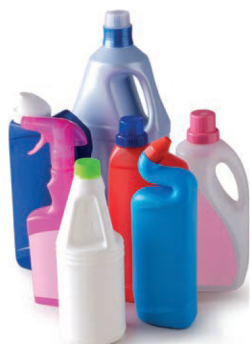
Flacons plastiques de produits ménagers avec les bouchons