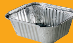
Barquettes alu propres