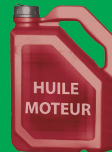
Bidons d'huile moteur

Encore un doute ? N'hésitez pas, Téléphonez-nous ! Numéro Azur : 0 810 440 500