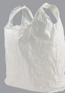
Films et sacs en plastique