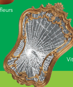
Vitres et miroirs

Encore un doute ? N'hésitez pas, Téléphonez-nous ! Numéro Azur : 0 810 440 500