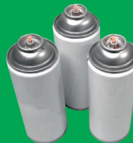
Aérosols non vides