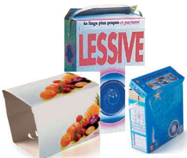
Boîtes et suremballages en cartonnage