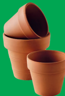
Pots de fleurs