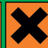
Flacons de produits portant ces symboles