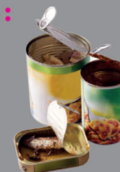
Conserves contenant des restes