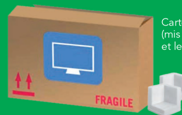
Cartons (mis à plat) et le polystyrène

Encore un doute ? N'hésitez pas, Téléphonez-nous ! Numéro Azur : 0 810 440 500