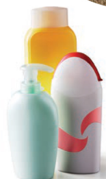
Flacons plastiques de produits de toilette