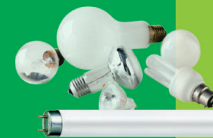
Ampoules et néons