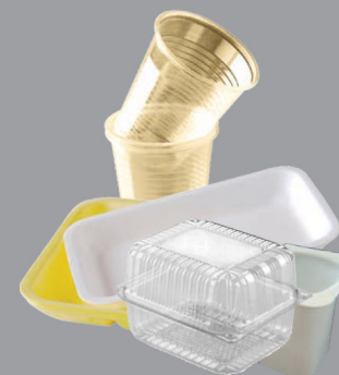
Petits emballages plastiques et polystyrènes