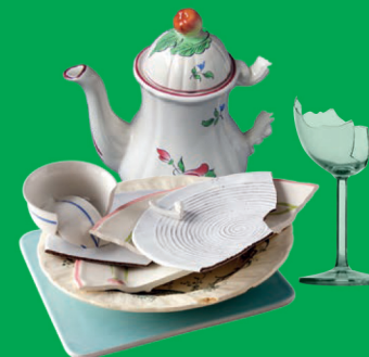
Vaisselle, faïence, porcelaine, cristal