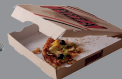
Papiers et cartons gras