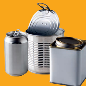
Boîtes et conserves métalliques

Je mets en vrac et vides dans la colonne à repère JAUNE :