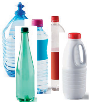
Bouteilles plastiques : eau, jus de fruit, lait, soda... avec les bouchons

Je mets en vrac et vides dans la colonne à repère JAUNE :